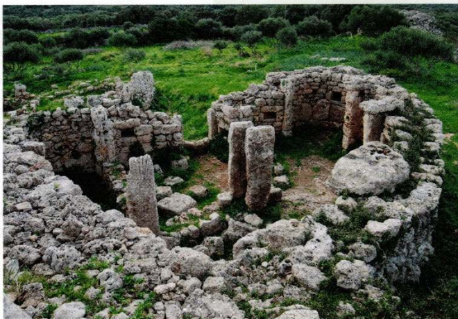
En la isla de Menorca, España, se localizan diversas construcciones megalíticas elaboradas por las primeras tribus organizadas de la isla, como el santuario de So na Caçana.

El origen de la sociedad europea inició con las siguientes agrupaciones: